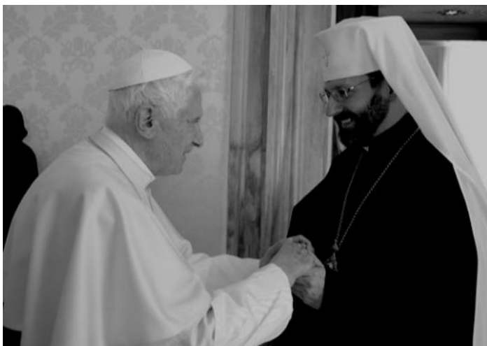
UGKB Didysis Arkivyskupas Sviatoslav Ševčuk privačioje audien-cijoje pas popiežius Benediktas XVI. Roma, 2012 m. kovo 16 d.

1991 m. UGKB vadovas kardinolas Myroslav Ivan Liubačivskij grįžo iš emigracijos Romoje į Lvovą, o 2005 m. UGKB centras perkeltas į ankstesnę metropolitų sostinę Kijeve, kur kairiajame Dniepro krante dabar baigiama