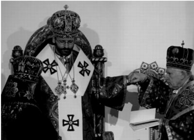
Didžiojo Arkivyskupo Sviatoslavo Ševčuko intronizacijos ceremonija Kijeve 2011 m. Seniausi UGKB vyskupai pasodina Arkivyskupą į patriarcho sostą

Jau per keletą metų po legalizavimo Ukrainoje UGKB pavyko atkurti parapijų skaičių, kuris buvo prieš Lvovo pseudosirinkimą, ir net jį viršyti. Šiuo metu UGKB yra didžiausia Rytų Katalikų Bažnyčia. 2011 m. lapkričio mėnesį įkūrus naujas metropolijas Vakarų Ukrainoje UGKB priklauso 7 metropolijos (4 – Ukrainoje, po vieną – Lenkijoje, Kanadoje ir JAV), kurios apjungia 7 arkivyskupijas, 16 vyskupijų ir 6 egzarchatus. UGKB turi apie 6 milijonus tikinčiųjų (iki legalizavimo pagal 1990 m. Annuario Pontificio UGKB turėjo vos 708 000 tikinčiųjų...), iš kurių 1,2 milijono gyvena už Ukrainos ribų, 3 900 parapijų (iš kurių 3 700 – Ukrainoje), 49 vyskupus, apie 3 500 kunigų, 100 diakonų, 1 000 vyrų vienuolių, 1 500 vienuolių seserų ir virš 600 seminaristų. Ukrainoje veikia 115 vienuolynų ir 16 aukštųjų dvasinių mokyklų. Romoje veikia dvi popiežiškosios ukrainiečių – Šv. Juozapato ir Dievo Motinos Globos – kolegijos, kurioms vadovauja vienuoliai bazilijonai.