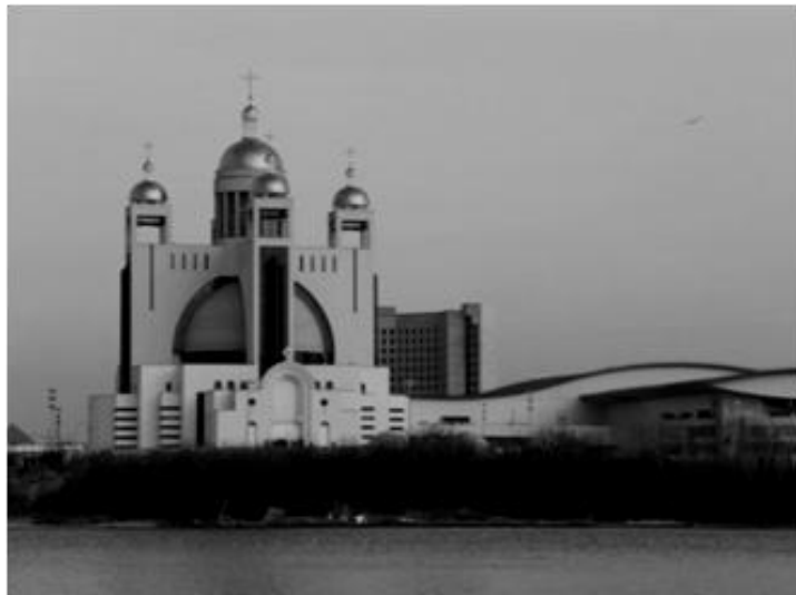
Naujoji Patriarchinė UGKB Kristaus Prisikėlimo katedra Kijeve

Šioje vietoje verta padaryti digresiją. Šiandien galima dažnai išgirsti aukščiausių Maskvos patriarchato hierarchų pareiškimų, kad viena pagrindinių ekumeninio dialogo tarp Katalikų Bažnyčios ir Rusijos Stačiatikių Bažnyčios kliūčių ir pagrindinė Romos popiežiaus ir Maskvos patriarcho susitikimo kliūtis yra graikų apeigų katalikų įvykdymas „smurtinis trijų Vakarų Ukrainos stačiatikių vyskupijų nusiaubimas“. Ir iš tikrųjų, pvz., prieš UGKB legalizavimą 1989 m. vienoje iš trijų Vakarų Ukrainos sričių – Lvovo srityje – veikė 1 260 Maskvos patriarchato parapijų, 1991 m. jų beliko 60 (!). Kaip suprasti šią statistiką? Pirmiausia reikia pasakyti, kad Maskvos patriarchatas Vakarų Ukrainoje su jos 350 metų graikų apeigų katalikiškomis tradicijomis (prieš Lvovo pseudosusirinkimą Lvove – ir visame regione – gyvavo tik viena stačiatikių cerkvė, ir ta pati priklausė Lenkijos, o ne Rusijos Stačiatikių Bažnyčiai) visada buvo laikoma okupantų Bažnyčia ir svetimšale. Savo autoritetą ji prarado ir aktyviai bendradarbiaudama su KGB, pirmiausia likviduojant UGKB. Jeigu po 1946 m. ji buvo toleruojama, tai tik dėl to, kad nebuvo alternatyvos praktikuoti viešą religinį gyvenimą. Atsira-