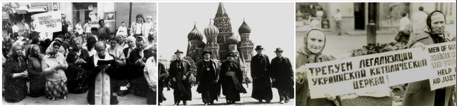
UGKB doasininkai ir tikintieji per bado streiką už UGKB legalizaciją. Maskva, Arbatas, 1989 m.

Šioje vietoje verta padaryti digresiją. Šiandien galima dažnai išgirsti aukščiausių Maskvos patriarchato hierarchų pareiškimų, kad viena pagrindinių ekumeninio dialogo tarp Katalikų Bažnyčios ir Rusijos Stačiatikių Bažnyčios kliūčių ir pagrindinė Romos popiežiaus ir Maskvos patriarcho susitikimo kliūtis yra graikų apeigų katalikų įvykdymas „smurtinis trijų Vakarų Ukrainos stačiatikių vyskupijų nusiaubimas“. Ir iš tikrųjų, pvz., prieš UGKB legalizavimą 1989 m. vienoje iš trijų Vakarų Ukrainos sričių – Lvovo srityje – veikė 1 260 Maskvos patriarchato parapijų, 1991 m. jų beliko 60 (!). Kaip suprasti šią statistiką? Pirmiausia reikia pasakyti, kad Maskvos patriarchatas Vakarų Ukrainoje su jos 350 metų graikų apeigų katalikiškomis tradicijomis (prieš Lvovo pseudosusirinkimą Lvove – ir visame regione – gyvavo tik viena stačiatikių cerkvė, ir ta pati priklausė Lenkijos, o ne Rusijos Stačiatikių Bažnyčiai) visada buvo laikoma okupantų Bažnyčia ir svetimšale. Savo autoritetą ji prarado ir aktyviai bendradarbiaudama su KGB, pirmiausia likviduojant UGKB. Jeigu po 1946 m. ji buvo toleruojama, tai tik dėl to, kad nebuvo alternatyvos praktikuoti viešą religinį gyvenimą. Atsira-