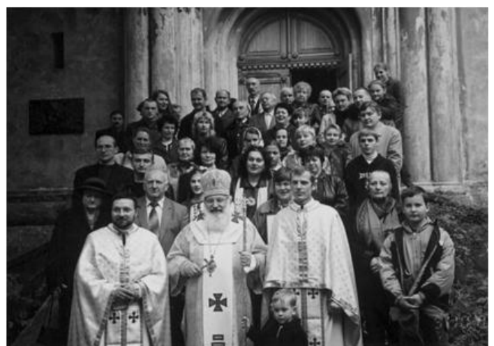
Didysis Arkivyskupas kardinolas Liubomyr Huzar kartu su Vilniaus parapijos tikinčiaisiais 2003 m.

Lietuvoje graikų apeigų katalikams priklauso Vilniaus Švč. Trejybės bažnyčia ir šalia jos esantis bazilijonų vienuolynas. Kartą per mėnesį vienuoliai kunigai irgi švenčia Mišias kartu su ukrainiečiais graikų apeigų katalikais Elektrėnuose, Jonavoje bei Klaipėdoje ir su baltarusiais graikų apeigų katalikais Kaune.