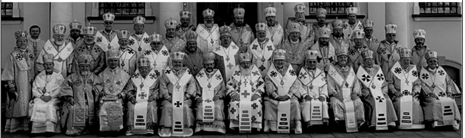
UGKB vyskupai per 2011 m. sinodą Lvove

dus tokiai galimybei, atstatydama istorinį teisingumą, pirmiausia atgijo UGKB. Norintys pasilikti stačiatikius ieškojo būdų tai padaryti išvengiant Maskvos. Taip buvo įkurta nepavaldi Maskvai Ukrainos Autokefalinė Stačiatikių Bažnyčia (neseniai vienas iš tuometinių Maskvos patriarchato vyskupų, kuris bendradarbiavo su saugumo organais, dabartinis Kijevo patriarchas Filaretas pareiškė, kad Ukrainos Autokefalinė Stačiatikių Bažnyčia buvo ypatingasis KGB projektas siekiant sutrukdyti UGKB plitimui). Taigi Maskvos Bažnyčia Vakarų Ukrainoje liko be tikinčiųjų ir kunigų, taigi ir be bažnyčių; tiesa, dėl Ukrainos Stačiatikių Bažnyčių ne visas šventoves atgavo ir jų istoriniai savininkai, patys graikų apeigų katalikai (apie 90% bažnyčių, kuriomis dabar naudojasi Vakarų Ukrainos stačiatikiai, yra pastatytos graikų apeigų katalikų). Todėl kaltinti UGKB ir po 20 metų daryti pareiškimus apie 1946 m. neteisingai pasisavinto turto grąžinimą (o Rusijos Bažnyčia ir toliau tyli apie savo bendradarbiavimą su saugumo organais likviduojant UGKB, nors tai yra dokumentais įrodytas istorinis faktas) nebeegzistuojančioms bendruomenėms atrodo ne tik nepagrįsta, bet ir, švelniai tariant, keista.