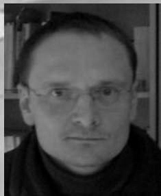
Kl. Žiloinas T., I k.

04.01-04.15 seminaristai atliko Velykų liturginę praktiką parapijose, džiaugėsi Kristaus Prisikėlimu ir atostogomis.