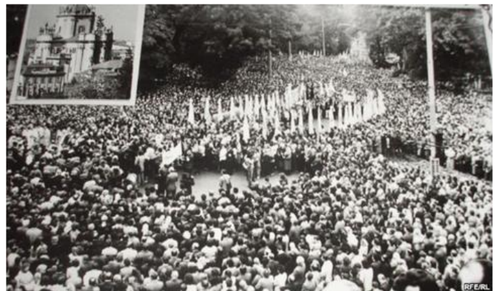
Demonstracija už UGKB legalizaciją. Lvovas, 1989 m. rugsėjo 17 d.