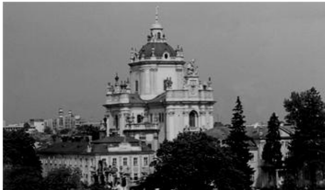
Lvovo šv. Jurgio graikų apeigų katalikų arkikatedra

Austrijos imperijos politika Bažnyčios atžvilgiu sudarė sąlygas UGKB vystymuisi ir net klestėjimui. UGKB tapo ukrainiečių tautinės tapatybės saugojimo ir puoselėjimo vieta, o XIX–XX a. UGKB dvasininkai buvo