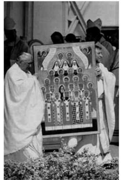
Sovietmečio kankinių beatifikacijos ceremonija 2001 m. Lvove. Išgyvenę sovietų lagerius kunigai įneša savo bendražygių – naujųjų palaimintųjų – ikoną

2011 m. vasario mėnesį buvo pranešta, kad popiežius priėmė 77 metų UGKB vadovo kardinolo Liubomyro Huzaro atsistatydinimą. Kovo 23 d. UGKB vyskupai naujuoju UGKB vadovu išrinko netoli Lvovo gimusį Buenos Airių ir Argentinos vyskupijos administratorių, jauniausią iš 50 UGKB vyskupų ir vieną jauniausių Katalikų Bažnyčios hierarchų, 40 metų Sviatoslavą Ševčuką.